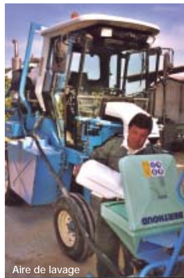
Aire de lavage